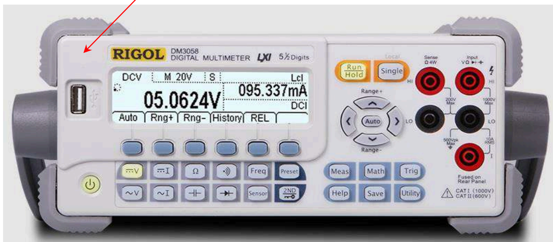
Рисунок 1 – Передняя панель Rigol DM3058