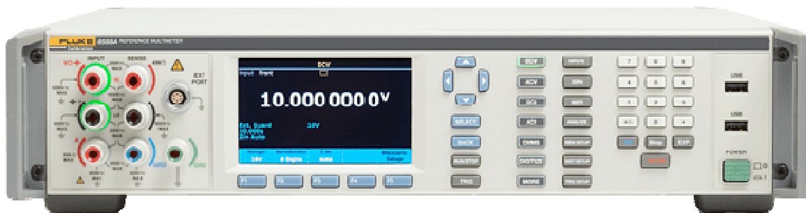
Рисунок 1 - Общий вид мультиметров 8558А, 8588А