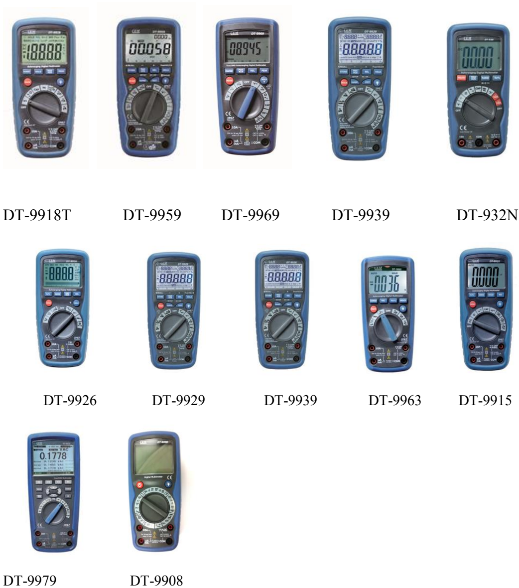
Рисунок 1. Фотографии общего вида мультиметров цифровых серии DT