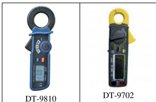
Рисунок 1. Фотографии общего вида клещей серии DT